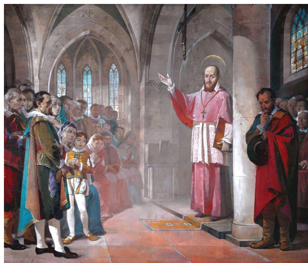
San Francesco di Sales e sordomuto Martino

Il costo del pranzo sociale è di €. 15,00 per tutti i soci, si prega di prenotare la partecipazione al pranzo entro e non oltre il giorno giovedì 2 febbraio 2012 rivolgendosi presso gli uffici dell'ENS di Venezia fax 041-5440866 o 041-5440501.